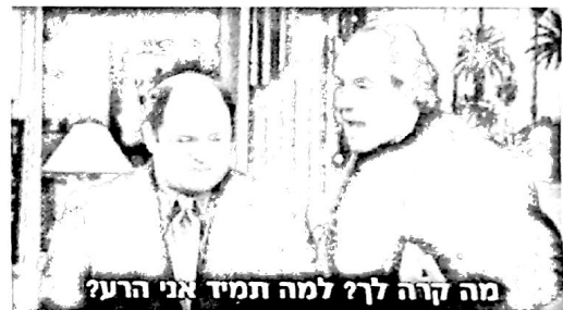
מה קרה לך? למה תמיד אני הרע?

כעת ראו לאן הגיע ג'ייסון אלכסנדר, איש יקר עם יכולת ניהול קרייירה של חתול דרוס. לאחר שהעמיד על גלגלה השמנמנת את הדמות הקור מית הגדולה - להלן הקטנה והמקריחה - ביותר בסיטקום האמריקני של שנות העשרים האחרונים, ג'ורג' קוסטנזה, ספק אם אלכסנדר יכול להתג לגל למשהו טוב יותר. ובוב פטרסון - שאלכסנדר שותף גם לכתיבתו - הוא מתעקש לגלם, מכל האפשרויות, גורו של עזרה עצמית הכותב ספ