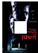
עמוד השדרה של השטן

4 מי שחתום על כתב האישום הם 3 גברים.. (לת)